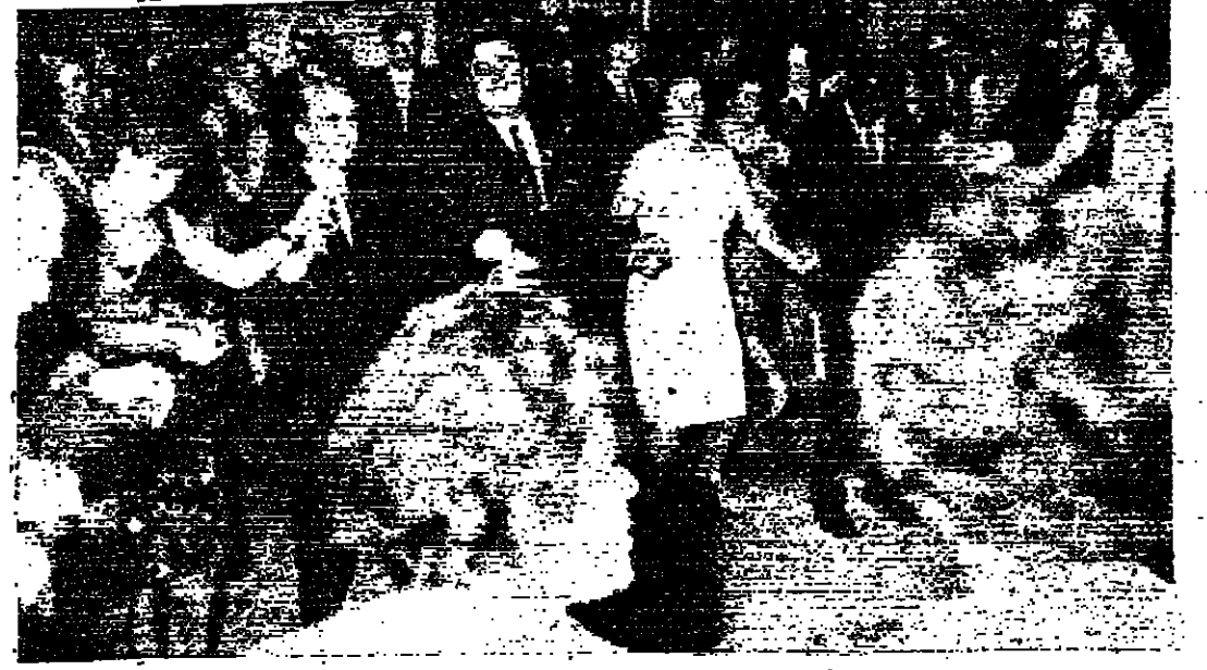
عرب وبلغاريون يؤدون رصة البليكة العربية أثناء مهرجان صوفيا العالمي